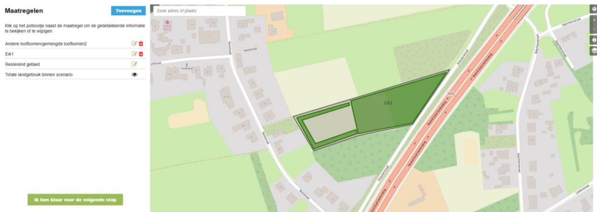
Figuur 3: Afbakening van een projectgebied met 'maatregelen' op kaart

De provincie Limburg wendde het instrument aan om ingrepen die pasten onder bepaalde klimaatacties te simuleren, telkens voor zo relevant mogelijke locaties en bij voorkeur geografisch gespreid om plaatselijke verschillen uit te vlakken. Louter ter illustratie worden hier enkele beelden weergegeven van welk soort informatie uit het instrument te halen valt: